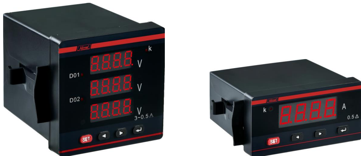
Рисунок 2 - Общий вид амперметров и вольтметров

Пломбирование амперметров и вольтметров не предусмотрено.